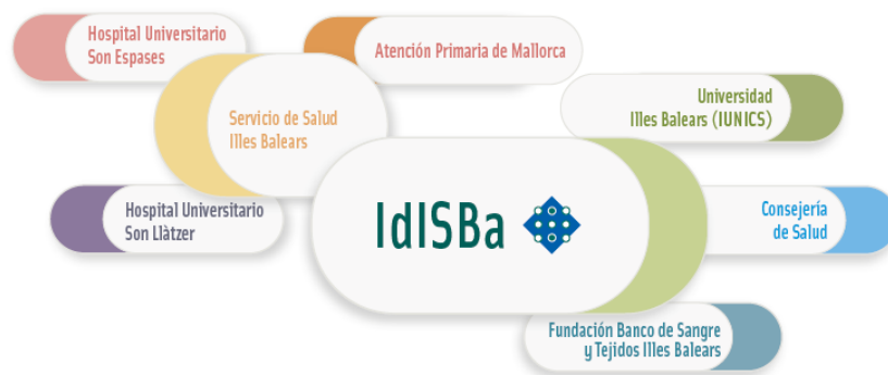
Figura 1: Entidades participantes Instituto de Investigación Sanitaria de las Illes Balears.

Así pues, mediante la firma de este convenio se formalizó la creación del Instituto de Investigación Sanitaria y se consolidó la estructura de las colaboraciones que se venían desarrollando desde hace años entre las diferentes entidades implicadas.